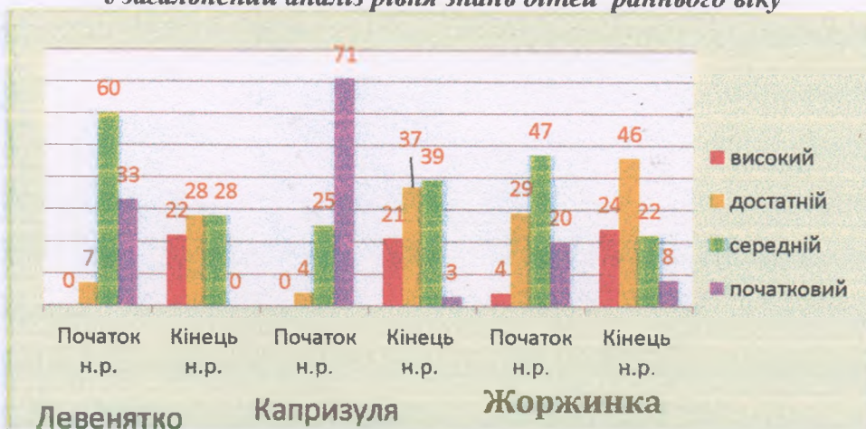
Узагальнений аналіз рівня знань дітей раннього віку

Обстеження компетентностей дітей молодшого передшкільного віку груп «Зернятко», «Трояндошка», «Світлячок» показало, що вихованці, у більшості, добре володіють культурно-гігієнічними навичками, правилами культури харчування відповідно віку, мають уявлення про свій організм, частини тіла, мають елементарні навички особистої гігієни.