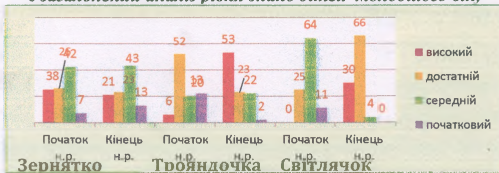
Узагальнений аналіз рівня знань дітей молодшого віку

Щодо освітнього напрямку «Дитина у соціумі», то діти знають своє ім'я, імена батьків, бабусь, дідусів. Усвідомлюють зміст поняття «сім'я», знають обов'язки кожного члена сім'ї, намагаються виконувати свої. Називають предмети домашнього вжитку, їх ознаки тощо.